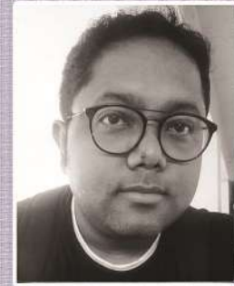
ড° হেমাংগ দত্ত ভাষাবিদ (মৃত্যু- ১৬ মে', ২০২১)