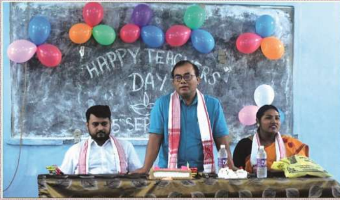
Teacher's Day Celebrations in the college