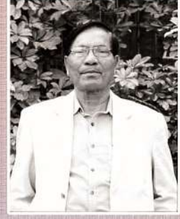
ড° প্ৰবীণচন্দ্ৰ দাস লোকসংস্কৃতি গৱেষক (জন্ম- ১৯৪১, মৃত্যু- ৪ চেপ্তেম্বৰ, ২০২২)