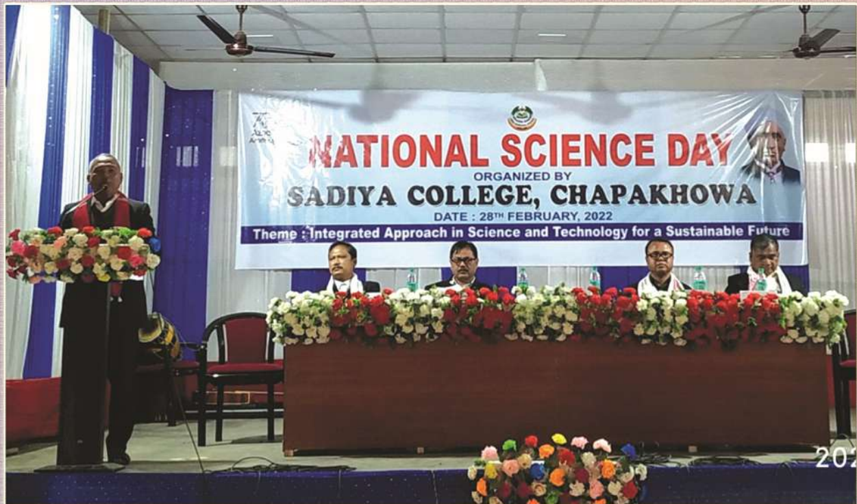
Mr. Jadav 'Molai' Payeng, Forest Man of India addressing the gathering in Science Day