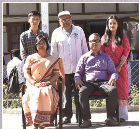
LIBRARY STAFF WITH PRINCIPAL