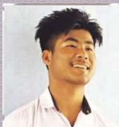
Barish Chiring Gymnasium Secretary