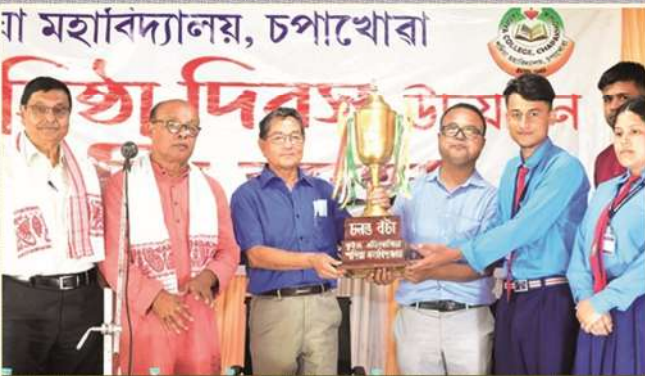
Students of Sunpura High School receiving the Trophy of 1st Prize in Quiz competition