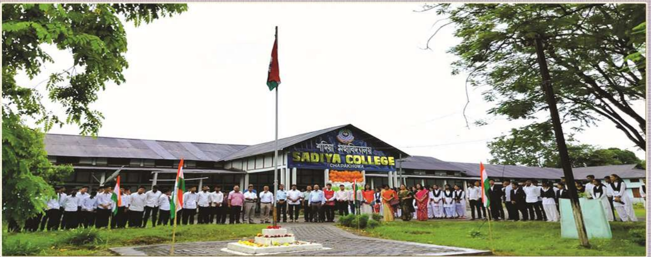
Independence day celebration on 15th August, 2022