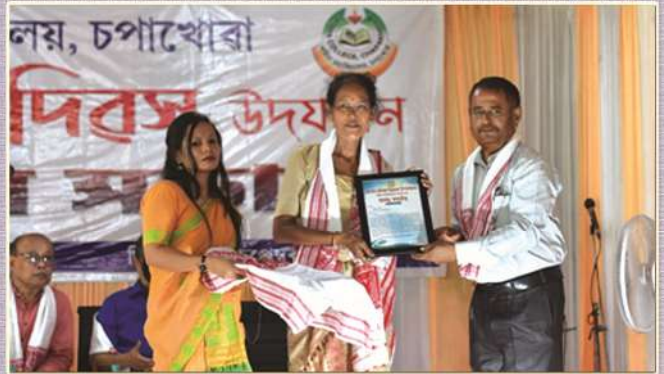
Felicitation of various stakeholders of Sadiya College from its inception