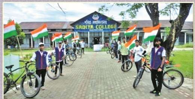
As a part of the Har Ghar Tiranga Programme, a talk on 'Flag Code of India- 2002' was organized by the NSS Unit, Sadiya College in collaboration with Department of Political Science, Sadiya College on 3rd August, 2022.