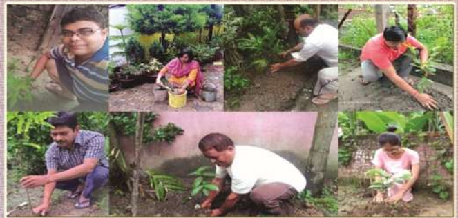
Plantation Drive on the Occasion of World Environment Day on 05th June, 2021