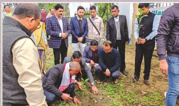
Mr. Jadav 'Molai' Payeng, Forest Man of India planting a sapling in the college campus