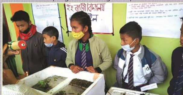
Students during Exhibition competition