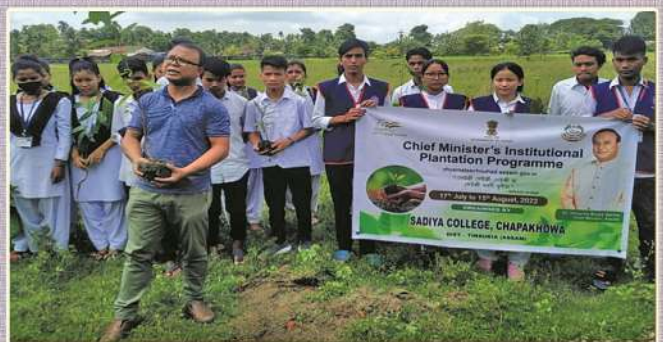
Chief Minister's Plantation Programme