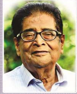
ড° লক্ষ্মীনন্দন বৰা সাহিত্যিক (জন্ম- ১৫ জুন, ১৯৩২, মৃত্যু- ৩ জুন, ২০২১)