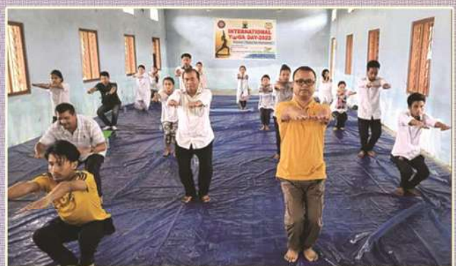
International Yoga Day Celebration 21st June, 2022