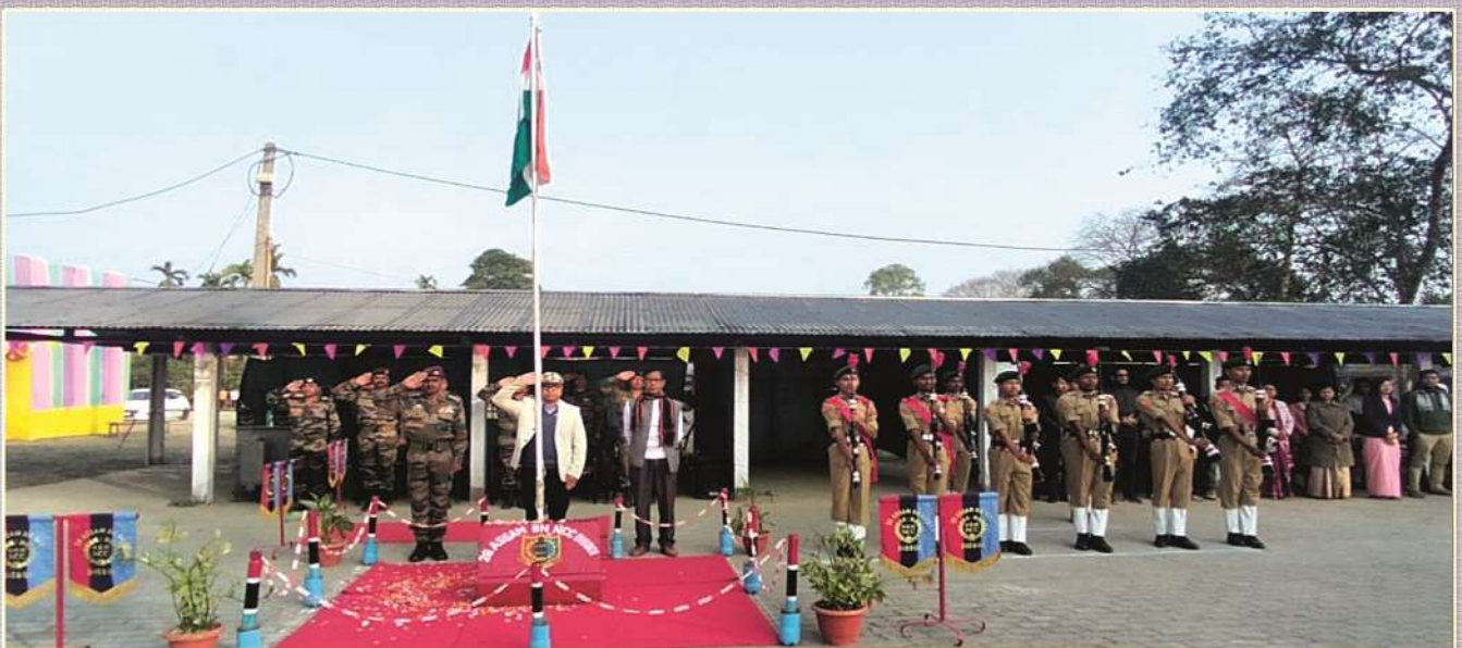
Republic Day celebration on 26th January 2023