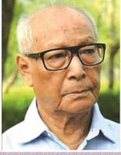
হোমেন বৰগোহাঞি সাহিত্যিক-বুদ্ধিজীৱী (জন্ম- ৭ ডিচেম্বৰ, ১৯৩২, মৃত্যু- ১২ মে', ২০২১)