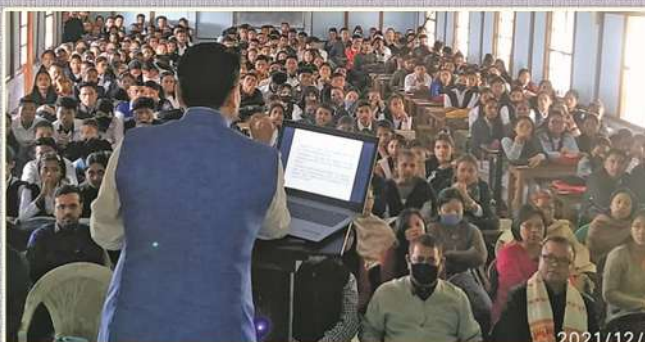
Talk cum Quiz Programme on 'Know your Constitution' on 23rd Dec., 2021 in collaboration with Dept. of Pol. Science, Sadiya College.