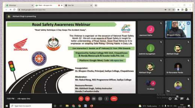
Webinar on Road Safety Awareness on 04th Feb., 2022