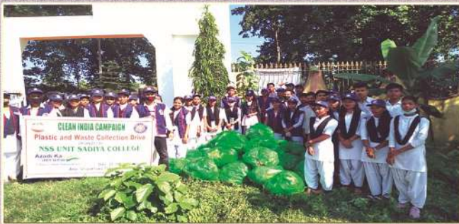
Plastic & Waste Collection Drive under Clean India Campaign on 29th & 30th Sept., 2021