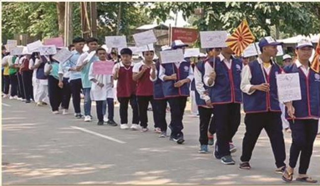
Anti-Drugs Campaign on 29th May, 2022