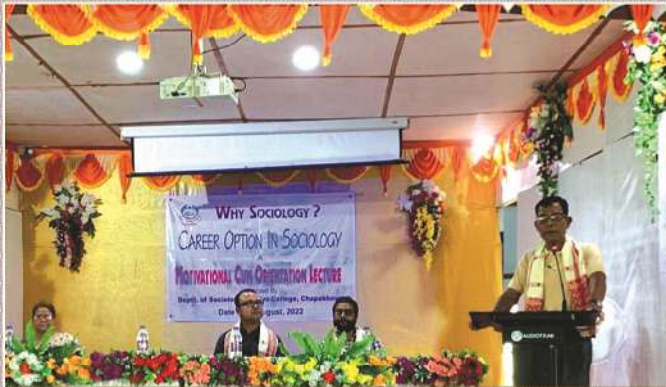
Career Options in Sociology organized by Dept. of Sociology, Sadiya College