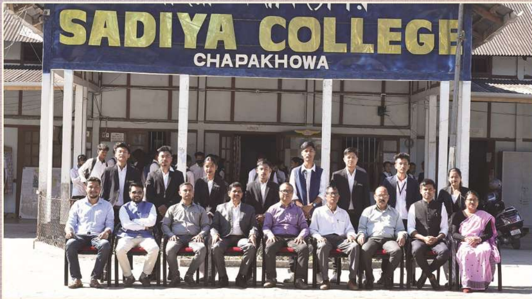
STUDENT UNION WITH PRINCIPAL AND TEACHERS