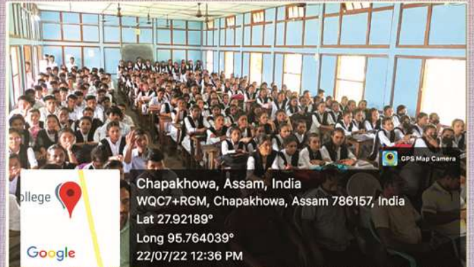
Students at Career Counselling Sessions