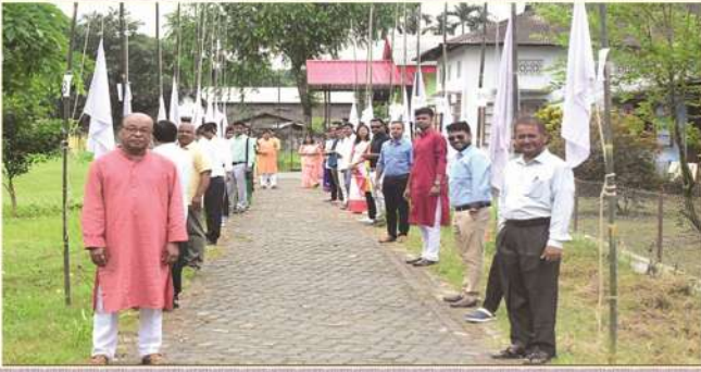
41 Nos of College Flags hoisted on the occasion of 41 st Foundation Day