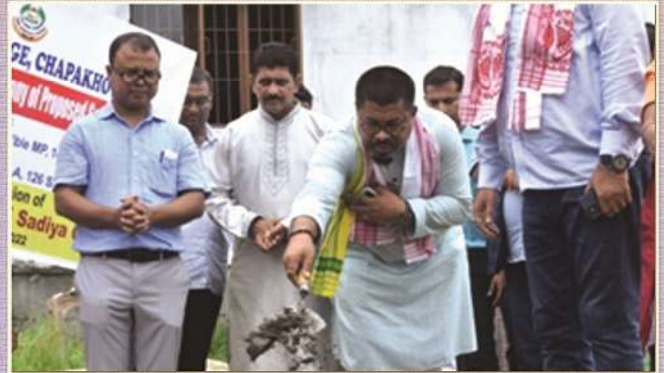
Foundation Stone Laying Ceremony of Science Building by Shri Pradan Baruah, MP, Lakhimpur LS Constituency, Shri Bolin Chetia, MLA, Sadiya LAC on 6th Sept., 2022