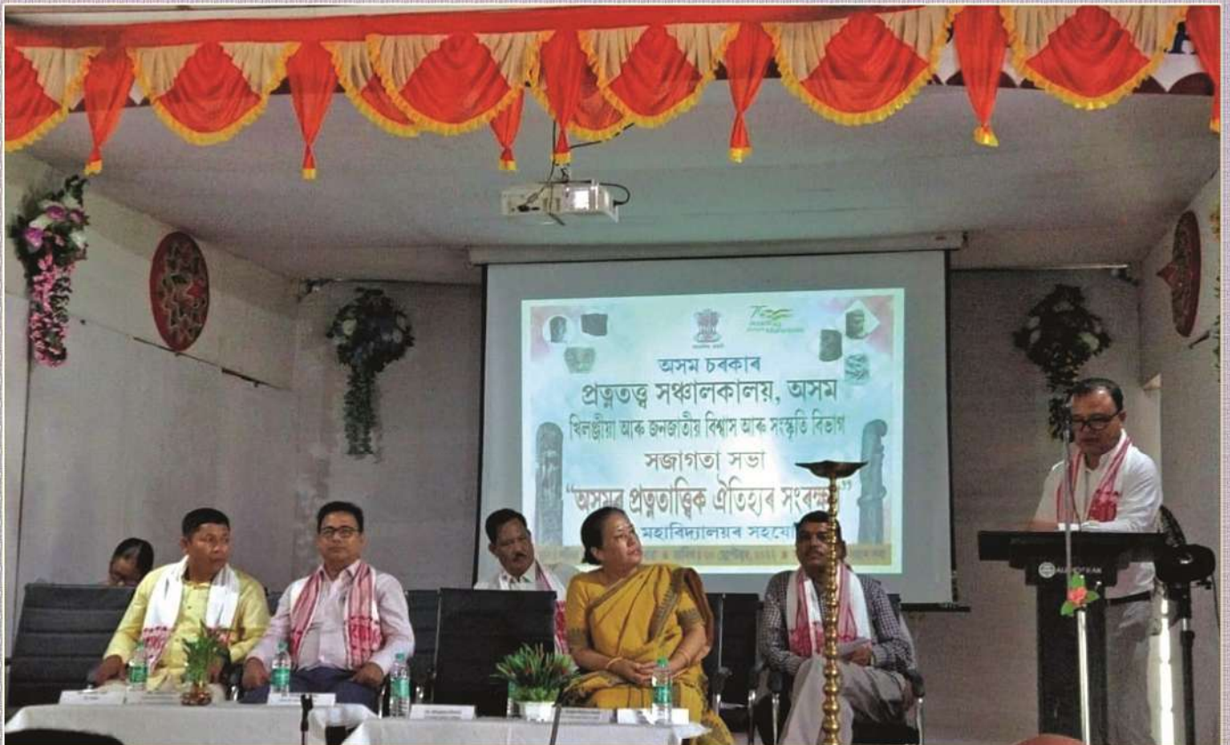
Awareness Programme on History of Assam, jointly organised by Sadiya College and Directorate of Archaeology, Govt. of Assam.